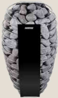
SPIRIT E (Kräver en separat styrenhet)

Bastuaggregatet Harvia Spirit E med separat styrenhet ger olika anslutningsmöjligheter för hemmabruk och kommersiellt bruk.