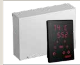
Xenio CX170XW WIFI styrenhet (Spirit E)