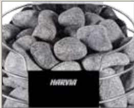
Rundade bastustenar 5-10 cm R-99