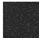
Black Slate Silk