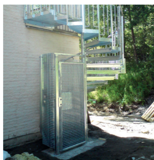
Kvartsbur i gallerdurk