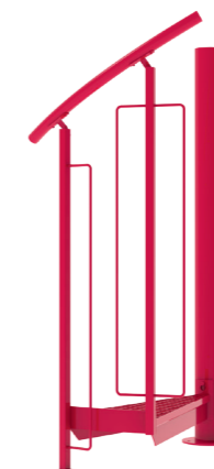
Enkelt räcke Målat