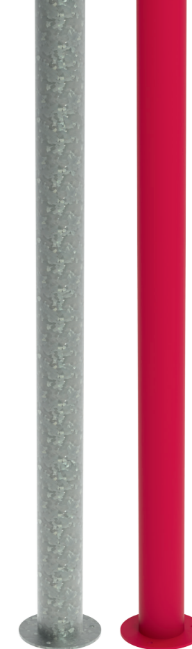
Centerstolpe Galvat vs Målat