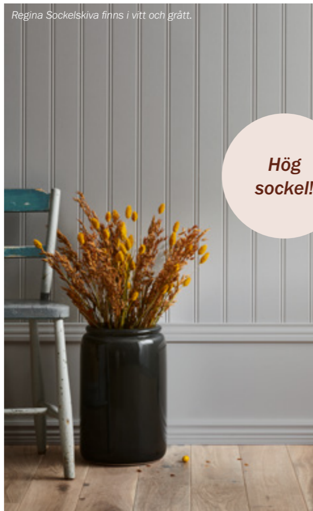
Regina Sockelskiva finns i vitt och grått.