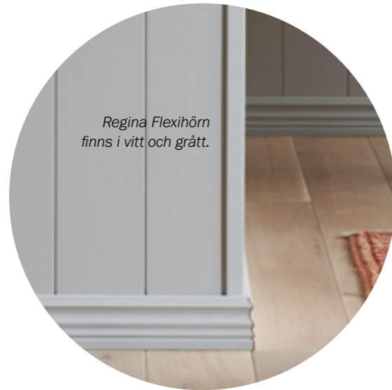
Regina Flexihörn finns i vitt och grått.